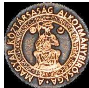
A Magyar Köztársaság Alkotmánybírósága

– a büntetőeljárásról szóló 1998. évi XIX. törvény 103. § (1) bekezdés b) pontja második fordulata alkotmányellenességének vizsgálata tárgyában készült végzéstervezet tárgyalása;